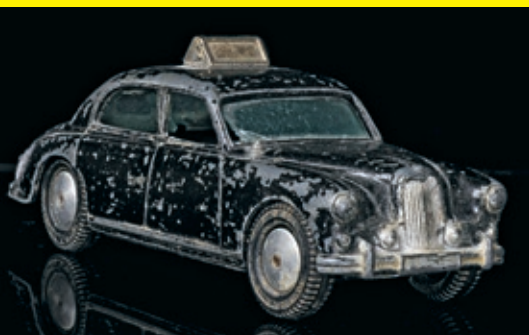
Ein schwarzer Riley Pathfinder als Polizei- auto von Corgi, ein grünes „Bottle Float“ von Matchbox (Vorbild war ein Commer FC für Milchboten) – solche Exoten rollten durch un- sere Kinderzimmer. Der Renault 4L von Dinky Toys mutet daneben fast gewöhnlich an