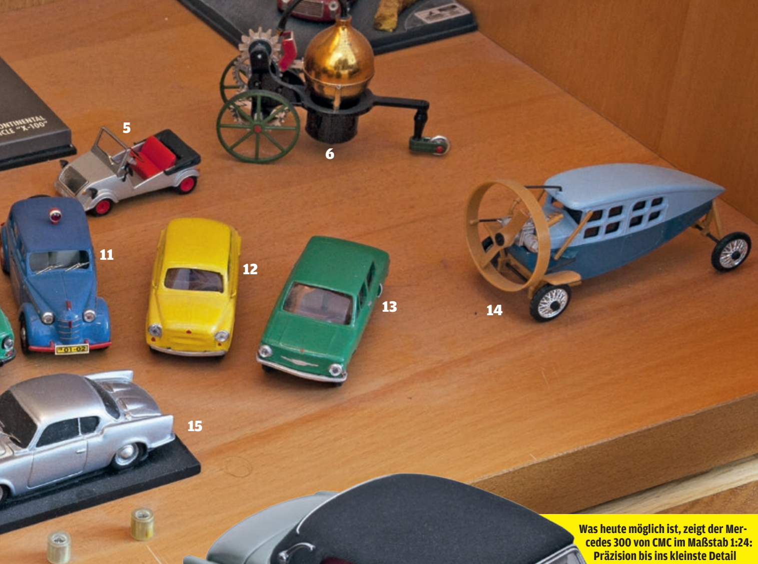
Was heute möglich ist, zeigt der Mercedes 300 von CMC im Maßstab 1:24: Präzision bis ins kleinste Detail