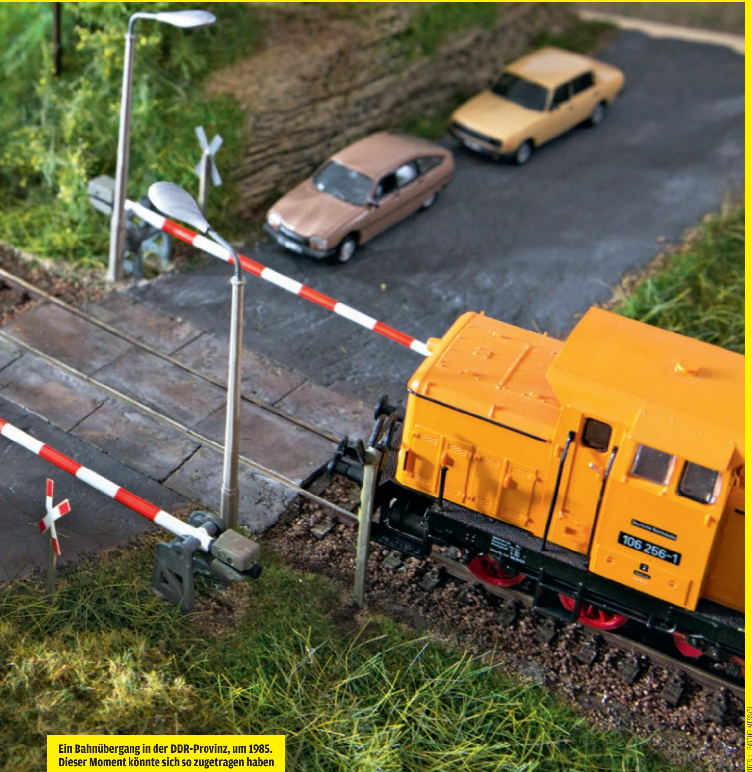
Ein Bahnübergang in der DDR-Provinz, um 1985. Dieser Moment könnte sich so zugetragen haben